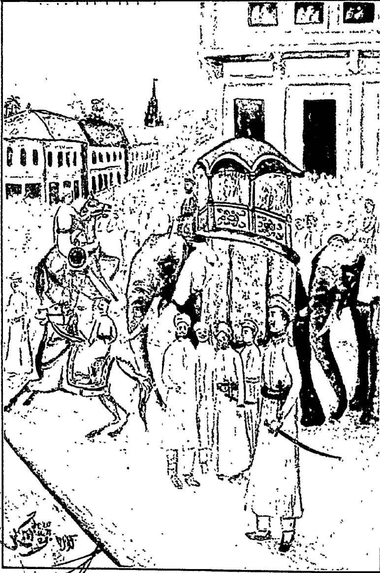
अयोध्या में श्रीरामचन्द्र का प्रवेश